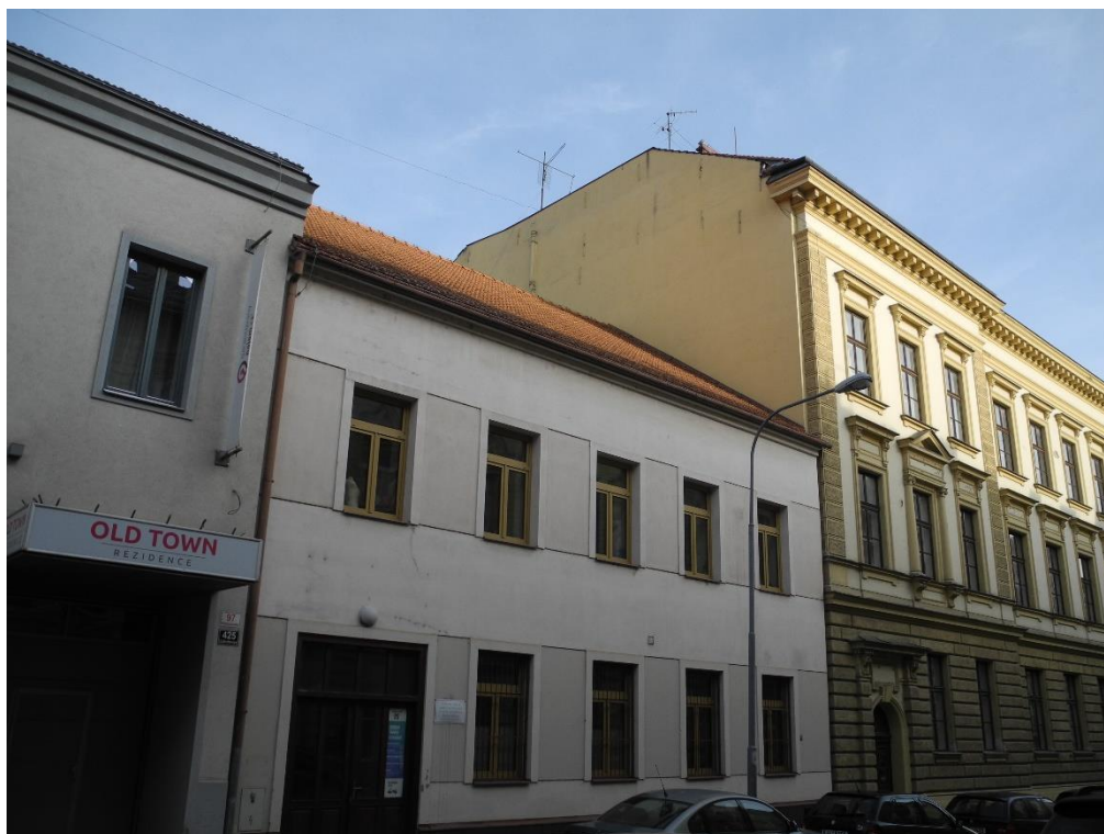
Obr. 1-2: Celkový stav objektu