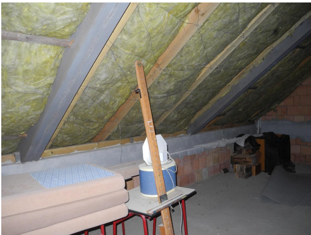
Obr. 3-4: Půdní prostory objektu