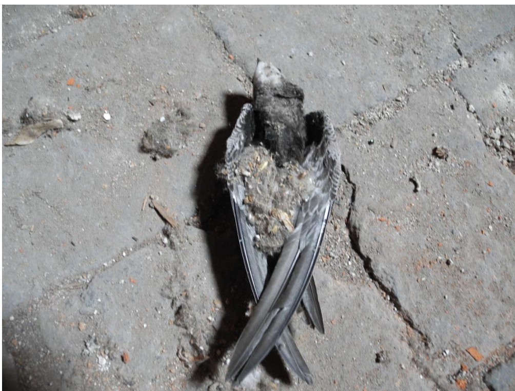
Obr. 5-7: Prostory vedlejší budovy školy, kde hnízdí rorýsi obecní (nalezen mrtvý)